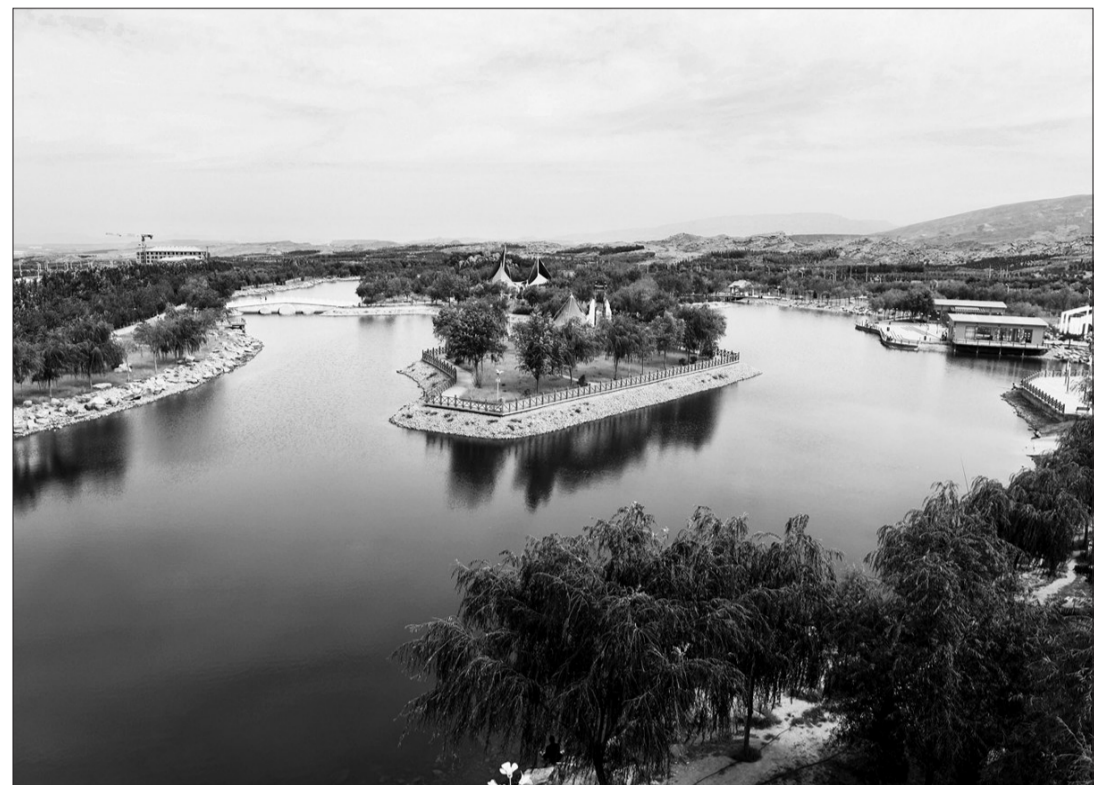
图为利用矿井疏干水精心打造的占地面积40多万平米的棋盘井生态公园。

6月,为加快推进整治工作,充分调动企业治污积极性,鄂托克旗结合工作实际,研究出台了《棋盘井蒙西地区环境综合整治补贴办法》。针对排土场修复治