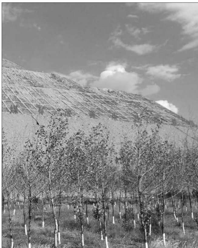
采取边坡护砌、台阶整形、黄土覆盖、网格加固、格内植树种草等方式,棋盘井蒙西地区已完成480万平方米排土场治理。图为天恩园煤矿排土场治理示范项目。

增容是在治理工程的加固、覆盖、网格化、道路修复、固废场清理等程序完成后,进行相应的造型、美容、播绿、植树等修饰性补救措施。年内计划新建矿区公共道路及采区道路23公里,翻修公共道路及采区道路48公里。目前,新建矿区公共道路13.1公里、19.93公里采区道路已完成硬化。同时,对采区道路实施不定期洒水降尘,清理道路周边固废垃圾1.8万吨,完成道路两侧植树37589棵,新增绿化面积约30万平方米。加大采空塌陷区治理力度,设置了400亩生态恢复治理绿化实验示范区。完成5个矿区约57平方公里地质环境野外调查,编制了治理方案。