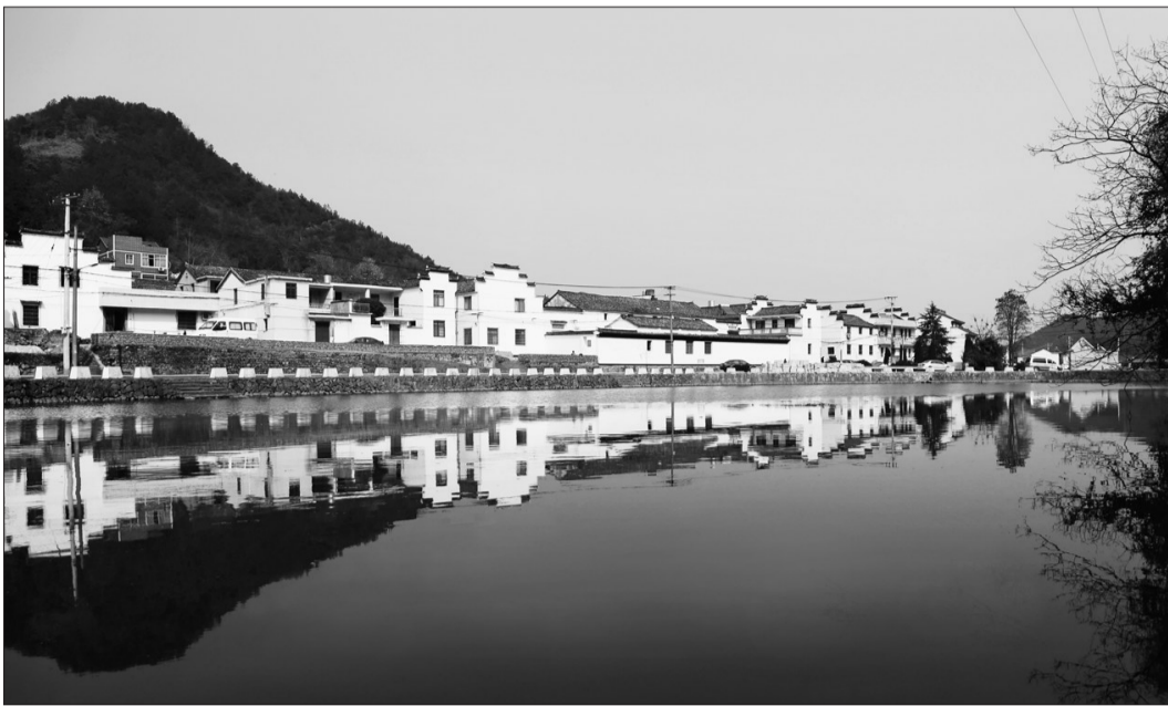
近年来,诸暨市努力建设“美丽诸暨”,生态市建设工作取得长足进展。图为诸暨市生态新农村。