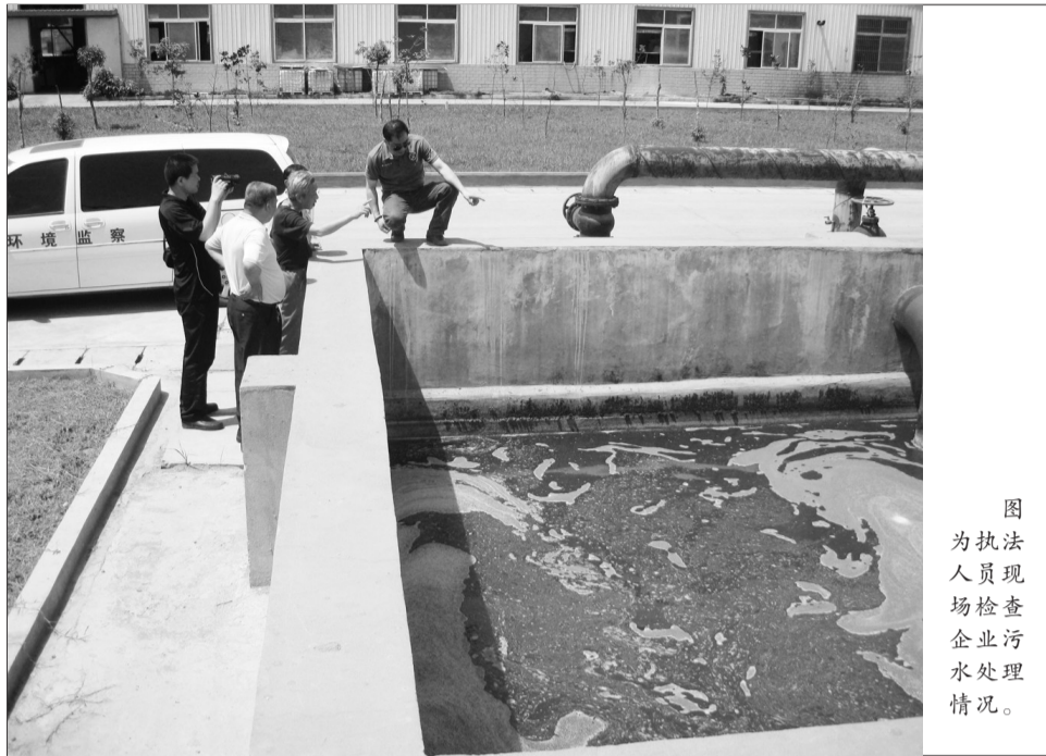
图为执法人员现场检查企业污水处理情况。

此次环保综合督查内容全、覆盖广、声势大,督查力度和规模前所未有,充分体现了湖北省委、省政府对环保工作的高度重视和铁腕治污的坚定决心,在全省各地引起了强烈反响,有力增强了各级政府环境保护责任意识,推动解决了一批群众关心的热点难点问题,取得了初步成效。