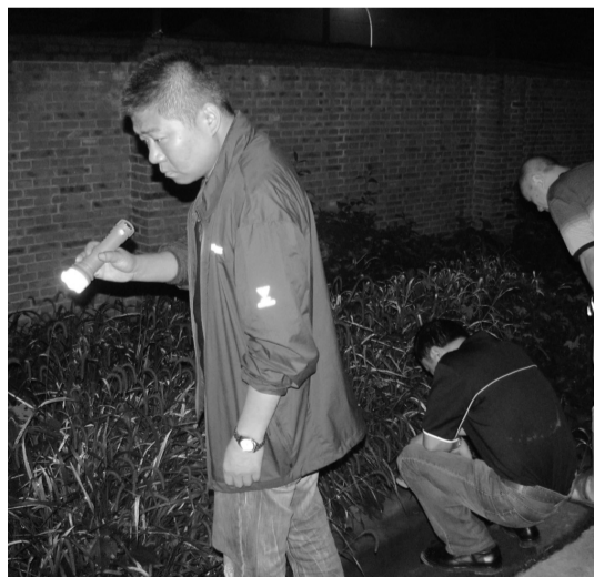
图为执法人员夜查企业排污管道。

严格处理处罚。对环境违法行为,全省始终保持环境执法的高压态势,坚持零容忍,切实做到“不查清不放过、不处理不放过、不整改不放过”。充分运用《环境保护法》及配套办法,多部门联合打击环境违法行为。2016年1月~8月,全省共实施行政处罚1372件,罚款金额约10568.1万元。全省共实施行政处罚案件18件,查封扣押案件108件,限产停产案件43件,移送行政拘留案件61件,移送涉嫌环境污染犯罪案件14件。与去年同期相比,处罚数量和质量均得到大幅度提升。李伟