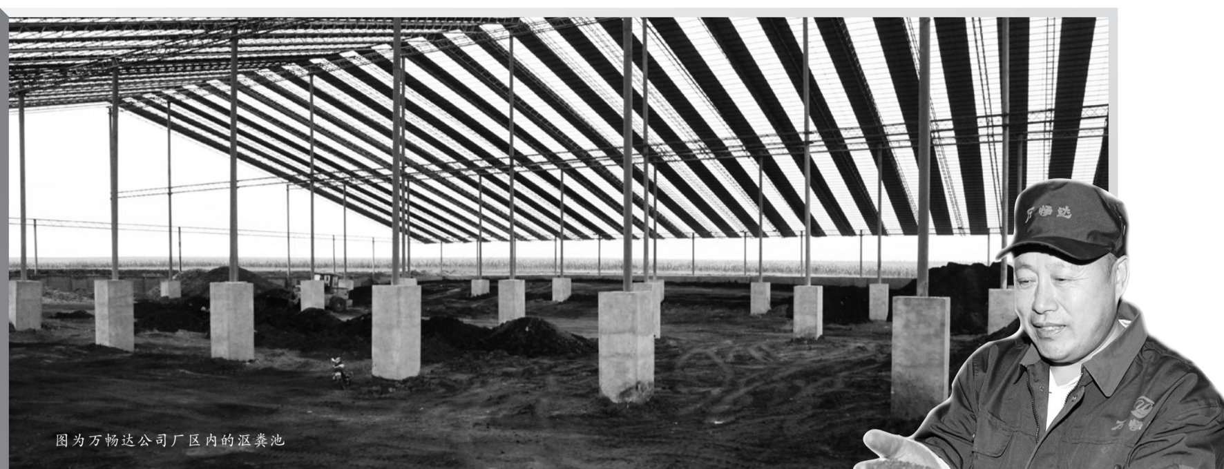
图为万畅达公司厂区内的沉淀池