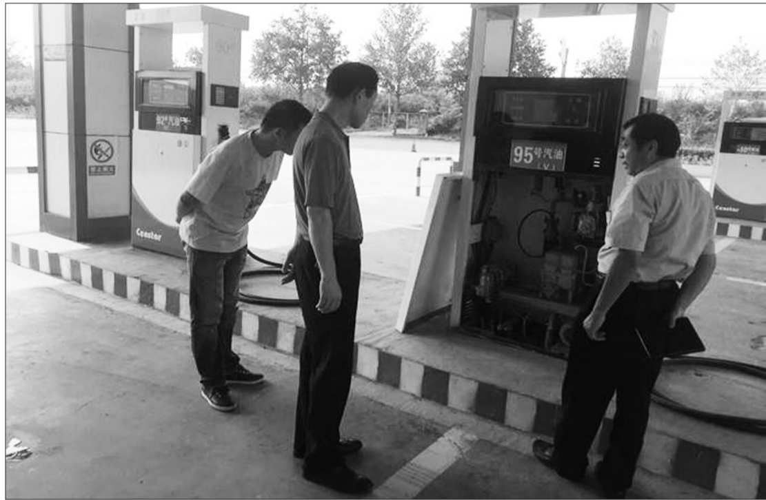
针对现阶段空气中臭氧超标问题,山东省潍坊市扎实开展加油站臭氧污染防治检查,规范油气回收设施及运行管理。