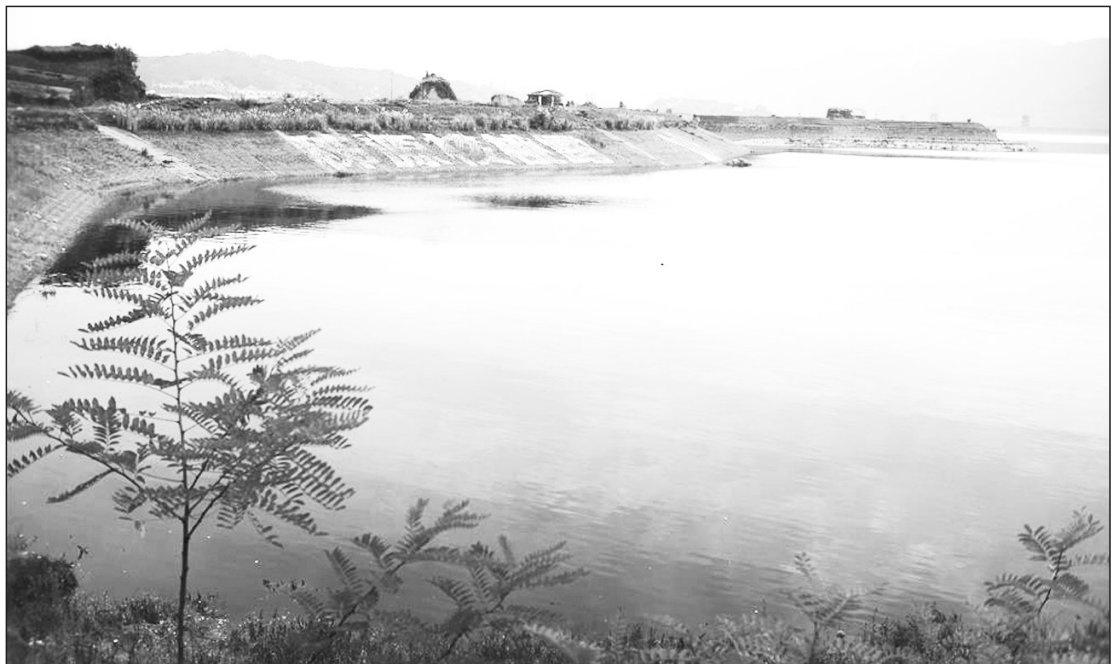
10月8日,湖北省宜昌市秭归县三峡水库水位上涨。中国长江三峡集团公司发布的水情信息显示,7日凌晨,三峡水库正式启动第九次175米试验性蓄水。根据国家防总要求,三峡水库在10月底或者11月争取蓄水至175米。

被誉为辽宁绿色屏障的辽东山区,主要指抚顺、本溪、丹东等区域。今年辽宁环保世纪行宣传活动采访组将分别奔赴抚顺、本溪、丹东等市,深入辽东山区腹地,采访浑河源头保护区、老秃顶子国家级自然保护区、鸭绿江口湿地自然保护区等生态保护情况,及大伙房水源保护区部分乡村的农村环境治理情况。