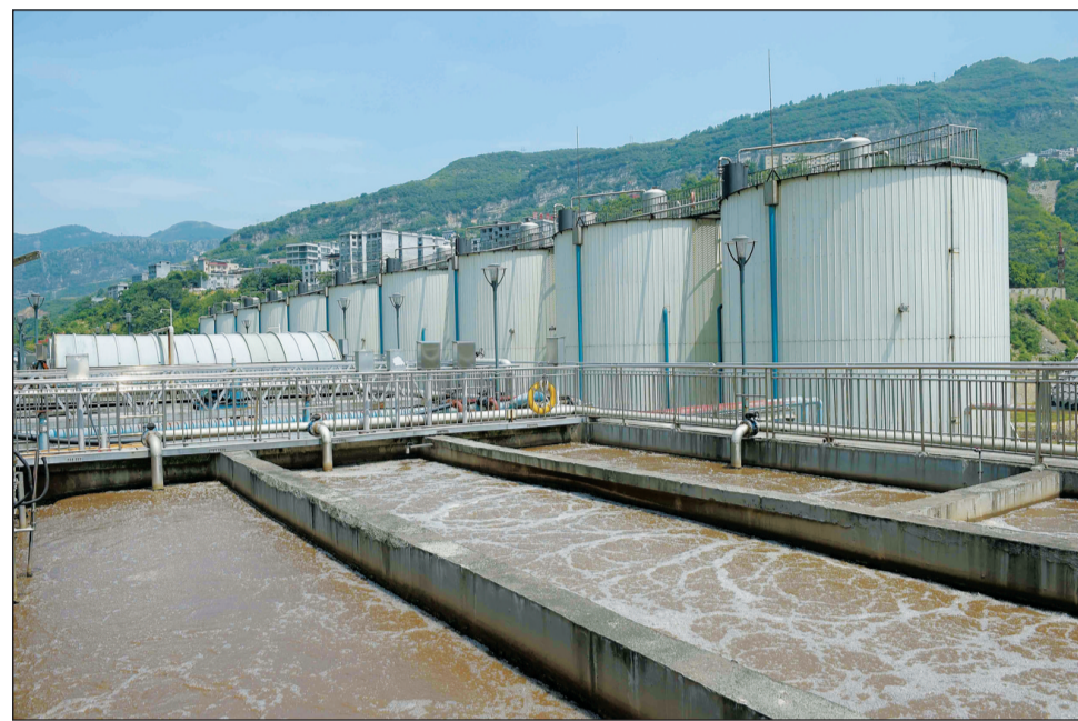
四川省泸州市古蔺县近年来积极响应云贵川三省环保联动机制,加大环保投入,依法关停小煤矿及养殖场,携手周边县市共同维护赤水河环境安全。图为建在赤水河边的古蔺县二郎污水处理厂站。