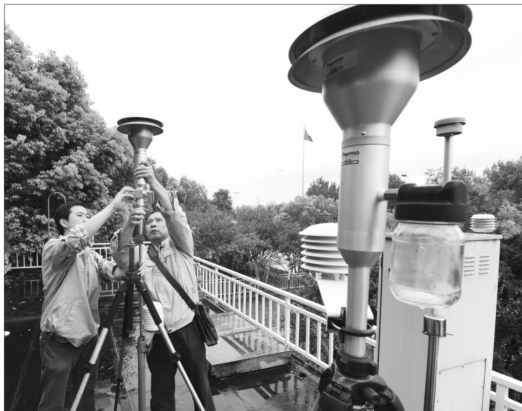
为落实《关于做好国家环境空气质量监测城市站社会化运维交接工作的通知》的要求,切实做好环境空气质量监测工作上收工作,湖北省恩施州环境监测站与中国环境监测总站委托的第三方运维公司全面完成了两个城市空气质量自动监测站社会化运维交接手续。图为技术人员对监测设备进行维护。

据悉,安徽省环科院将继续围绕《规划》确定的科技攻关任务,研究制定环境质量目标管理体系,加快安徽省淮河流域水污染物排放标准的制订,开展引江济淮工程清水廊道两侧水源保护区划定,加强引江济淮工程的排(泄)水环境管理研究,为确保引江济淮工程供水安全,充分发挥引江济淮工程的社会效益和生态环境效益做出贡献。