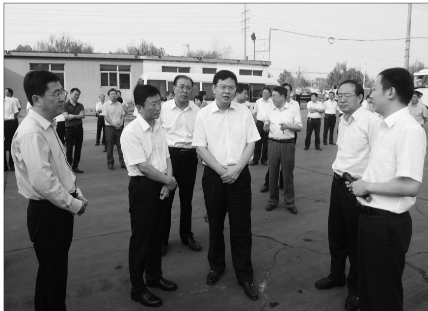
近年来,东营市坚持生态立市、环境优先,持续增加环保投入,提升治污能力,改善环境质量。图为东营市市长赵豪志(前右三)、副市长张润国(右二)调研企业治污情况。

东营市大力实施污水深度处理工程,强化工业聚集区工业污水处理,持续推进东营经济开发区、东营港经济开发区“一企一管”和地上管廊建设与改造。完善人工湿地系统,因地制宜