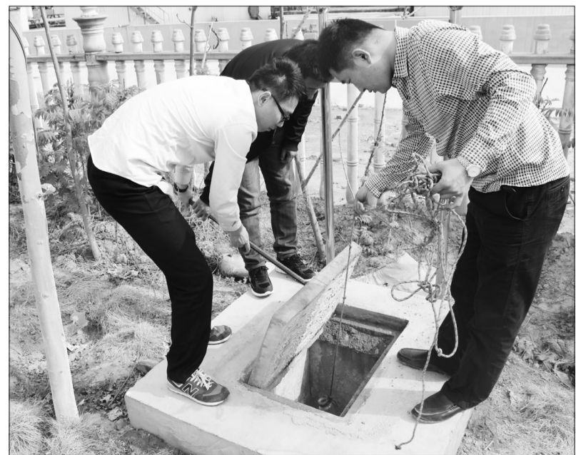
利津县环保局近年来不断加大环境监管力度,严查偷排、偷放等环境违法行为。图为执法人员在陈庄工业园对企业排放的废水取样监测。