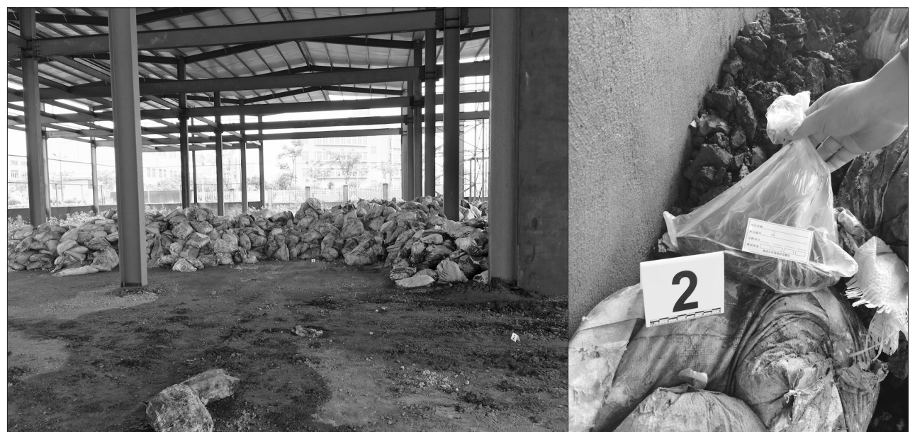
图为执法人员在案发现场查获大量污泥，并取样检测。

慈溪市环境监察大队将每一次案件的查办都作为实战来练兵，提升了业务能力，如由环境监察大队和监测站骨干对全体执法人员进行理论培训，学习和剖析新环保法、环境信访调处的基本要求、现场执法取证技巧和规范、采样监测技术要求等。“在执法大练兵中，我们边解决问题，边积累经验。”这位负责人说。