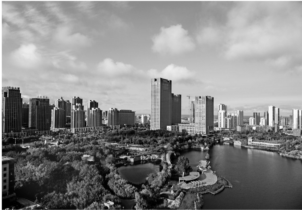
今年以来,日照市持续加大污染治理力度,开展环境综合整治集中攻坚,深化大气和水污染防治,环境质量得到明显改善。图为蓝天白云下的日照市银河公园。

近年来,随着工业化、城镇化进程的加快,日照市的城乡环境面临着日益严峻的考验。为改善环境质量,日照市把“生态立市”作为城市建设的最新定位和发展坐标,放在发展战略之首,从今年8月5日开始,针对重点流域、重点领域和重点企业,在全市开展水、气、突出环境问题集中攻坚行动,倒逼企业提高治污水平,推动产业转型升级。