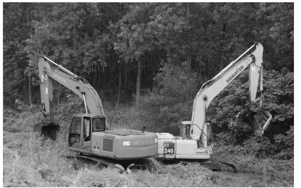
图为崮河流域清淤现场。

日照市水务集团在治污军令状面前,与时间赛跑,将原本需要3个月完工的厦门路污水处理厂缩短至45天。同时,组织有关企业参