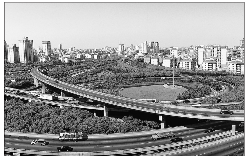
通过开展区域生态环境综合整治,上海市闵行区环境面貌和环境质量得到进一步改善。图为闵行区区外绿化带。