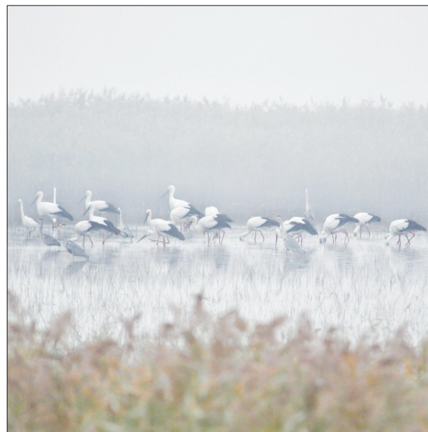
天津市滨海新区北大港湿地生态环境优美,每年都吸引大批鸟类在此停留栖息。截至目前,飞抵湿地的鸟类与往年同期相比数量明显增加。

据悉,云南省委办公厅、省政府办公厅印发了《关于加快中央环境保护督察组转办案件查处和责任追究的通知》,省环境保护督察工作领导小组办公室组织省委督查室、省政府督查室、省公安厅、省信访局、省环保厅组成联合督查组,对部分州(市)转办案件查处情况进行多轮现场督查。