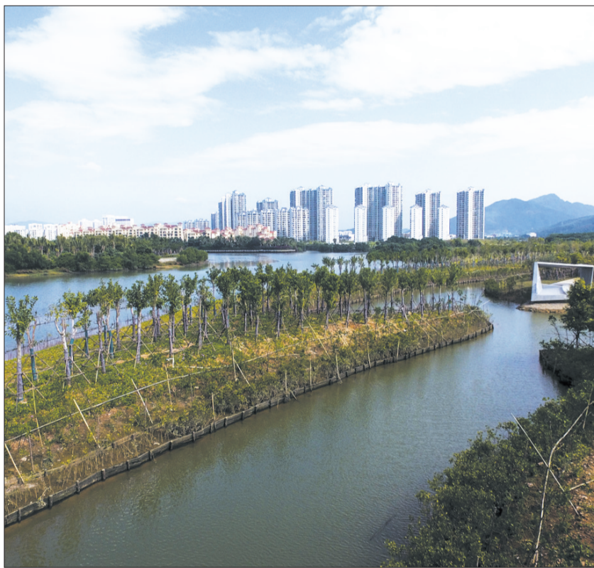
去年起, 海南省三亚开始在全国率先开展“生态修复、城市修补”试点工作, 着力整治城市发展乱象, 对久治不愈的“城市病”实施“根治术”, 百姓共享优质生态民生的获得感不断增强。图为建设中的三亚红树林生态公园。

咸辉强调, 督察组反馈意见的整改落实是硬任务、硬指标、硬要求。石嘴山市工业经济倚能倚重特征突出, 当前正处于产业转型升级的关键时期, 面临着各方面的压力和困难。但是, 一定要坚持绿色发展理念, 守住环保底线, 立行立改、加强监管、严肃问责, 逐条梳理、拉出清单, 列出时间表、路线图, 明确责任人, 该整改的整改, 该问责的问责, 下决心彻底解决问题。