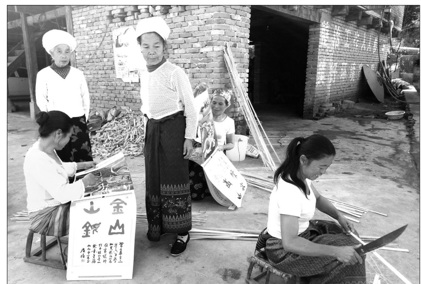
12月中旬,云南省环保厅在西双版纳傣族自治州开展环境宣教走基层活动,受到当地各族群众欢迎。图为勐海县勐海乡勐翁村委会曼兴村民小组的村民在翻看刚刚拿到的环境宣传资料。