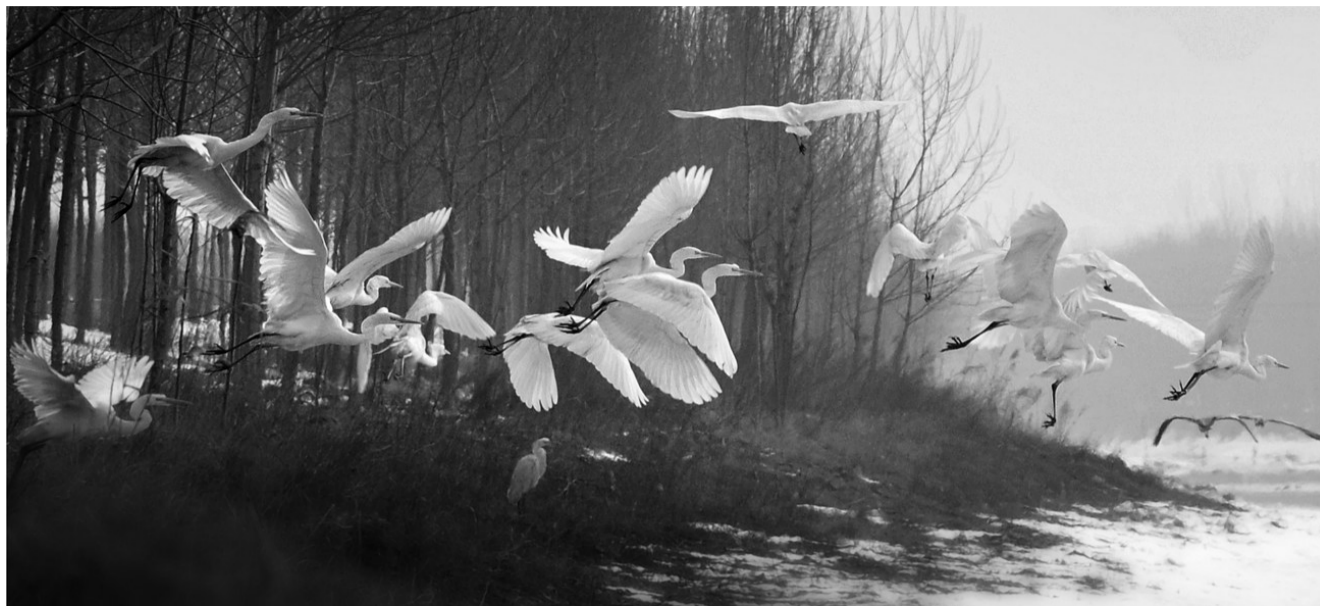
近年来,菏泽市实施碧水工程,城乡水环境质量得到改善。图为成群的白鹭在万福河边嬉戏。

为减少燃煤污染,菏泽市限期关停城区158座工业和生活锅炉;启动15个发电机组和37家10吨以上燃煤