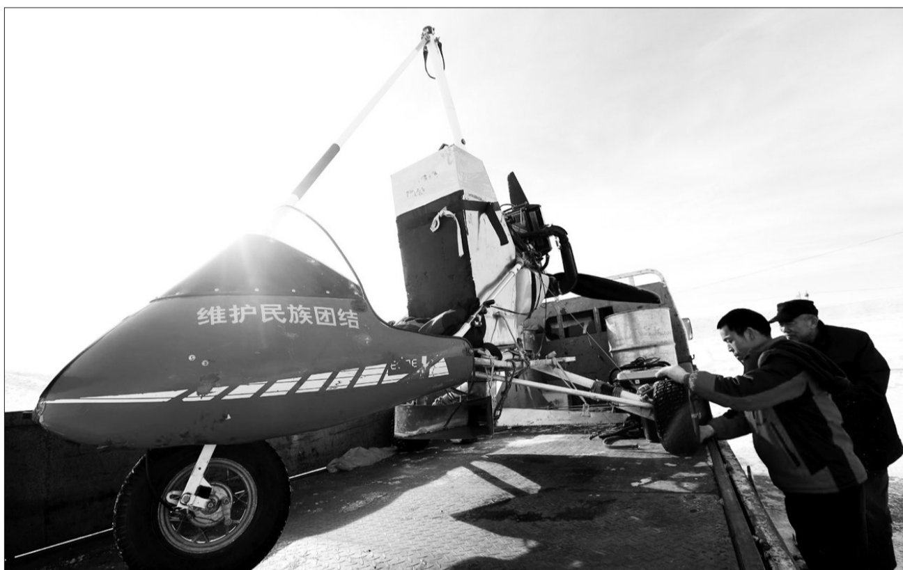
12月26日,在新疆生产建设兵团第五师八十七团米其克草原上,一架滑翔机正准备进行草籽播撒作业,这标志着该团草原植被恢复工作全面启动。近年来由于超载放牧,米其克草原草场植被开始退化。为恢复和保护天然草场,该团今年共投资550万元,对4.5万亩草场进行植被恢复工作。