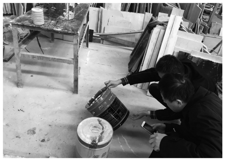
图为环境执法人员现场检查石材加工原料。

南京市环境监察总队再次来到产业园区后,对园区整改情况进行了全面了解,并对下一步整改提出了针对性的指导意见,同时明确未通过环保验收不允许开工。