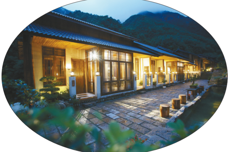
临安市运用“互联网+推介民宿”模式,发展生态经济。

浙江延杭智能科技有限公司是杭州的一家智能环保企业。经临安市农办多次对接,延杭智能与板桥镇达成了合作协议,在板桥镇环湖村建立了临安市首个村级智能垃圾分类收集点。这一系统借助物联网管理平台,可对村民的每一次垃圾分类投放实