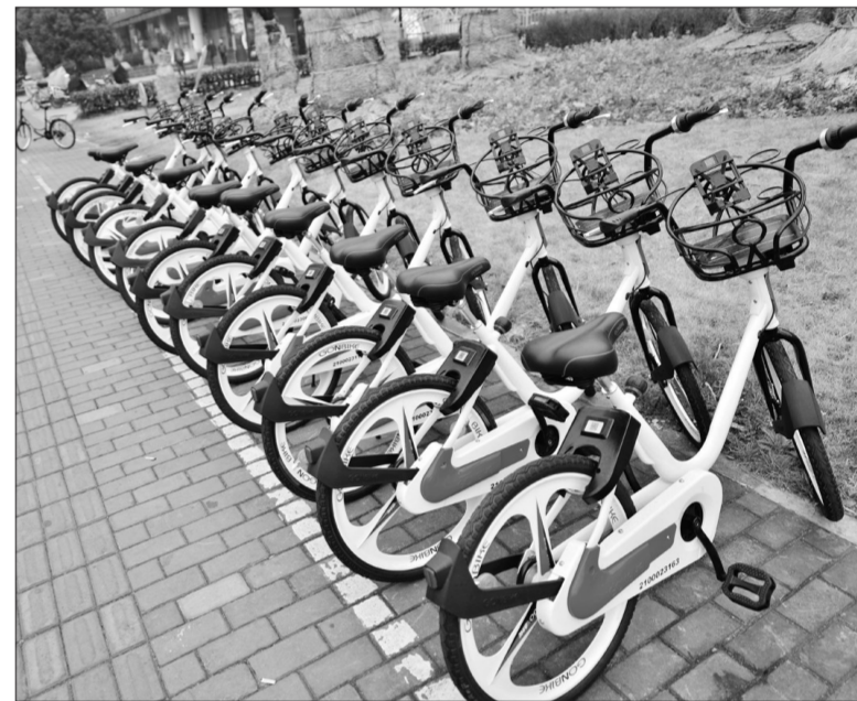
上海市一款名为共佰单车的“小白车”近日现身街头,其最大亮点在于可以边骑车,边给手机充电,仿佛一个带着轮子的移动“充电宝”。单车在车篮上设置了手机架,手机架上方还设有两个充电口,使用者在骑行的同时还能给手机充电,绿色环保。