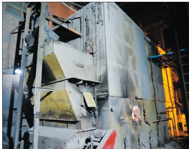
石家庄市晋州塑胶制品厂燃煤小锅炉正在运行。