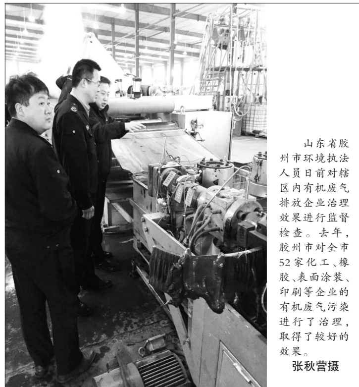
山东省胶州市环境执法人员日前对辖区内有机废气排放企业治理效果进行监督检查。去年,胶州市对全市52家化工、橡胶、表面涂装、印刷等企业的有机废气污染进行了治理,取得了较好的效果。