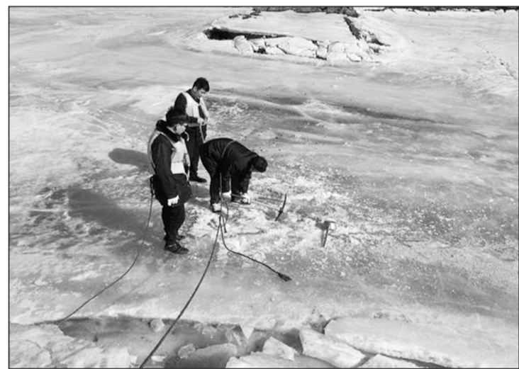
内蒙古自治区兴安盟环境监测站监测人员日前对哈拉哈河(大山矿)断面、绰尔河(入江口)断面、归流河(贾家街)断面及察尔森水库东、西入口等国控断面和洮儿河(八里八)区控断面进行破冰采样监测勘察。

通过提供出售统一装修房,减少装修建筑垃圾量。禁止违法海砂开采和应用,提高天然砂石资源的价格,让建筑垃圾资源化有市场空间和利润空间。