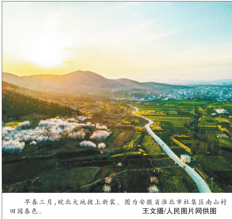
早春三月,皖北大地披上新装。图为安徽省淮北市杜集区南山村田园春色。

赵英民指出,2017年是脱贫攻坚承上启下、全面突破的关键之年。按照“三年集中攻坚、两年巩固提升”的总体部署,2016年~2018年为集中攻坚期,未来几年的脱贫任务更加繁重。要以习近平总书记扶贫开发战略思想为指导,乘势而上,更加扎实有力推进各项工作;要处理好经济发展和环境保护的关系、生态保护和脱贫攻坚的关系,内生动力和外部支持的关系,支持因地制宜发展特色产业,增强自我造血能力;要帮助农民和贫困户增收,认真做好精准扶贫;要强化和落实农村生态文明建设,加强基层党组织建设,引导农村群众积极参与生态文明建设;要在扶贫“最后一公里”上较较真,将各项工作落到实处。