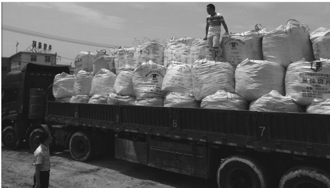
2014年4月~7月15日期间,中金岭南环保公司向瓯江倾倒化学污泥约4200吨。

经查实,2014年6月底~7月15日期间,中金岭南环保公司向瓯江倾倒化学污泥约2400吨。