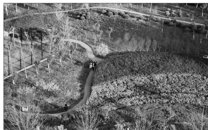
河南省周口市开发区广场公园内近日春意盎然,游人不断。近年来,周口市不断加大公园绿地等生态系统投入力度,使其成为居民休闲娱乐的好去处。

他勉励企业负责人,要进一步加大产品研发生产、环保设施技改投入力度,确保污染物达标排放,实现社会效益和社会效益双赢。在随后召开的座谈会上,马承祖指出,环境保护关乎发展、关乎民生、关乎群众满意度,是推动上饶转型升级、加快科学发展必须迈过的一道坎。做好环保工作是企业发展的前提,是地方经济发展、社会稳定的关键,要牢固树立以人为本的理念,切实把做好环保工作放在重中之重的位置,严把项目准入关,对污染企业坚决不予落地。 吕凤麟