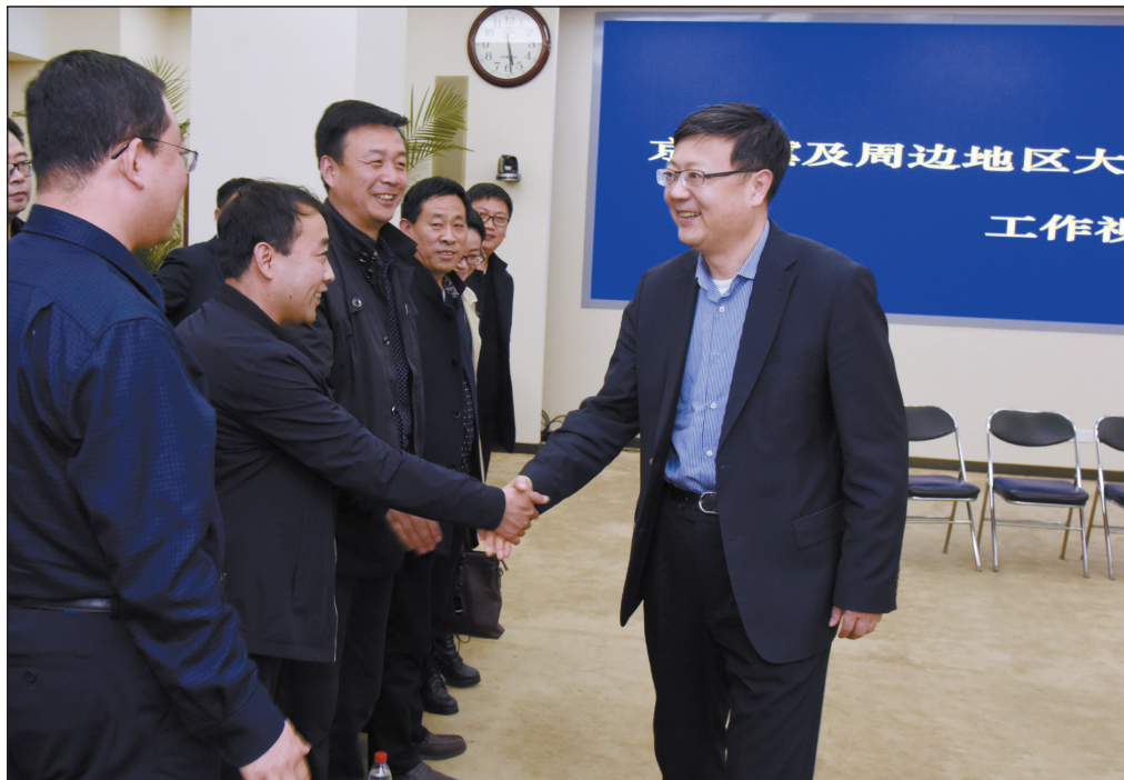
图为环境保护部部长陈吉宁与第一、二轮次督查组组长见面交流。

此次强化督查是环境保护有史以来,国家层面直接组织的最大规模行动,主要对7个方面进行督查,包括相关地方各级政府及有关部门落实大气污染防治任务情况,固定污染源环保设施运行及达标排放情况,“高架源”自动监测设施安装、联网及运行情况,“散乱污”企业排查、取缔情况,错峰生产企