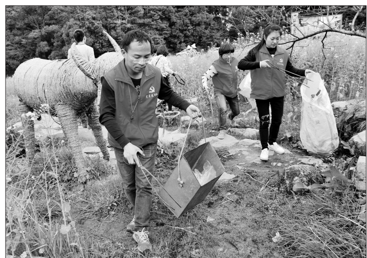
江西省婺源县江岭油菜花旅游观光旺季到来,为保持良好环境,婺源县委县政府组织机关干部身穿红马甲,来到当地万亩梯田油菜花海,义务收拾游客留下的生活垃圾,倡导游客文明出行、环保旅游。

按照计划要求,自治区发展改革委将制定各专项监察实施方案,依法对列入年度节能监察范围的用能单位进行现场抽查和书面监察,对发现问题的用能单位提出整改要求,对不按要求整改的进行公开曝光,为完成自治区“十三五”节能目标任务提供保障。 杨涛利