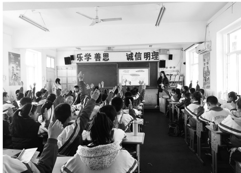
图为在课堂上小学生积极与志愿者互动。