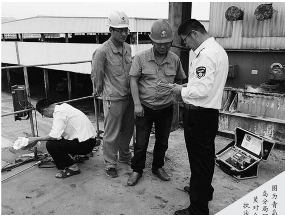
图为青岛局环保督察人员对企业进行执法检查。

为此,青岛市环保局黄岛分局根据《青岛市化工企业环保评级工作实施方案》,研究制定了黄岛区化工企业环保评级具体工作方案。