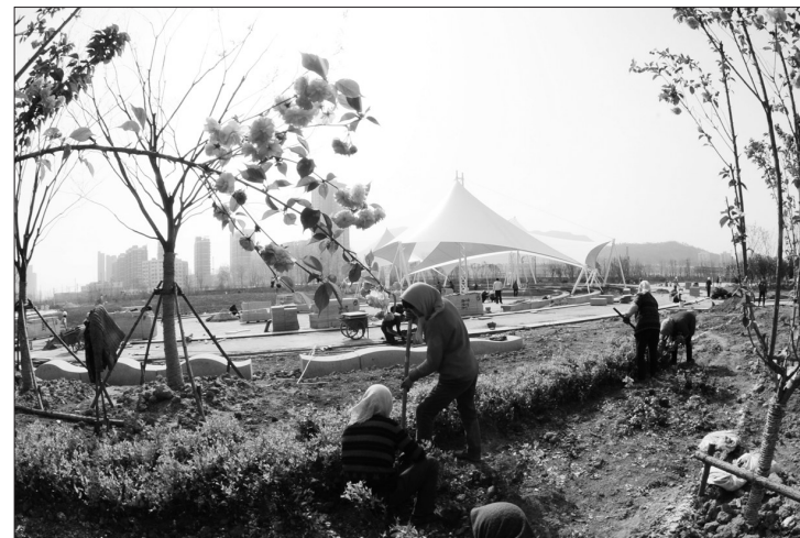
江苏省连云港新丝路零点公园将于5月亮亮,近日工人正在加紧施工。新丝路零点公园以“一带一路”为主题,引入沿线其他省市和中华文化元素,再现丝路各地微缩景观特色。