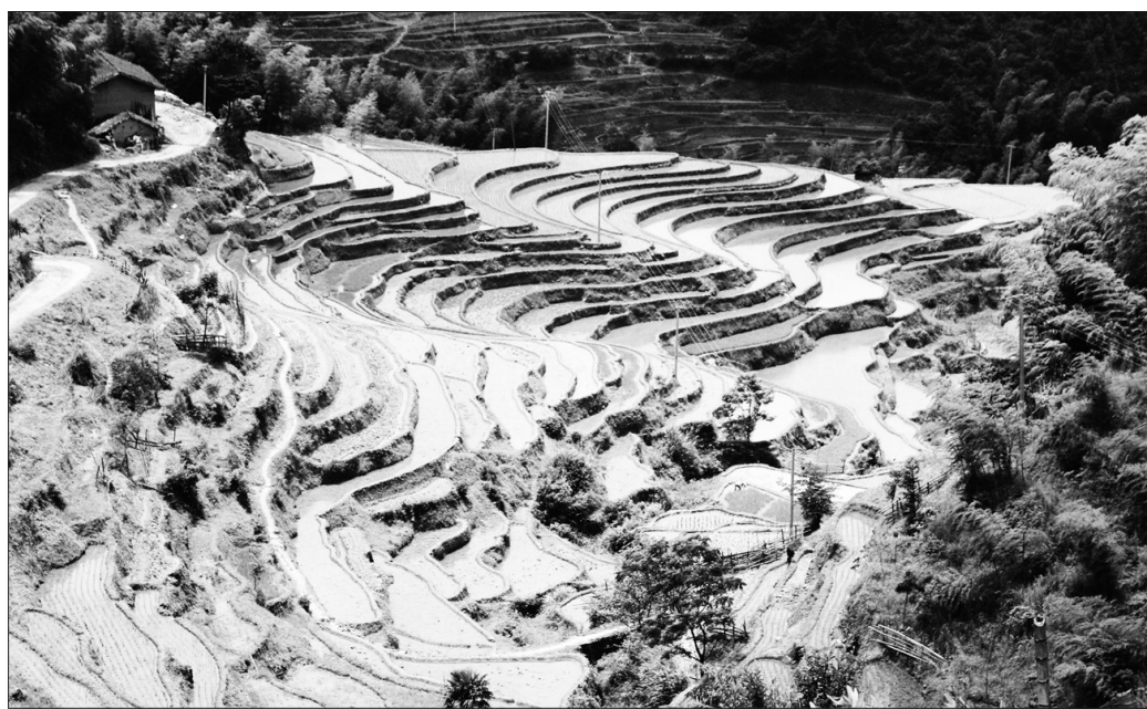
江西省遂川县着力打造“中国最美梯田之乡”,发展生态旅游。遂川县梯田以左安桃源梯田为中心,周围汤湖、禾源、大汾、营盘圩、戴家铺、高坪等乡镇,近万亩梯田连绵在全县7个乡镇几十个自然村庄。目前,各梯田群落的建设正在如火如荼地进行中。图为遂川左安桃源梯田。

据悉,下一步成都市将通过加大重型柴油货车抽检和治理力度、重型货车限行和入城管理,机动车尾气环保检测监督管理等系列措施,继续强化机动车尾气治理。同时,通过加强对建设工程、市政交通、拆迁(除)、绿化工地的扬尘控制,对夜间施工和运渣车的监管,不断加大对扬尘的治理力度。