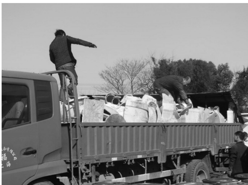
因为工人将下脚塑料粒子粉碎作坊收购的化学桶、化学管道装车运回启东。

据介绍,下一步,启东市环保局与市公安局还将以本案的办理为契机,继续加强执法联动,强化执法力度,营造启东打击环境违法犯罪的高压态势。