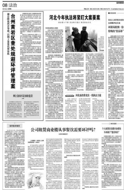
《(公司租赁商业楼从事餐饮需要环评吗?)》2017年4月13日本报8版)