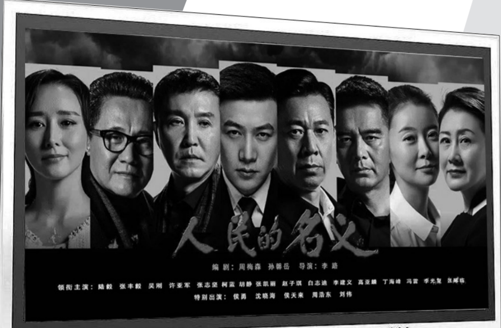
领衔主演:陆毅 张丰毅 吴刚 许亚军 张志坚 柯蓝 胡静 张凯丽 赵子琪 白志迪 李健文 高亚麟 丁海峰 冯雷 李光复 陈建斌 特别出演:侯勇 沈腾 侯天来 陶红 刘蓓

笔者认为,我们完全可以借助影视作品来为环保宣传服务,扩大传播效果,关键看我们是否真有这份耐心和真心。