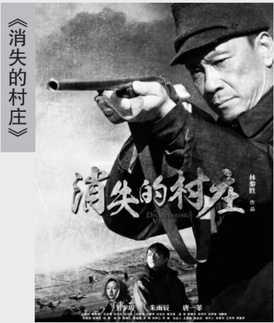
本片主要讲述了一个村庄的村民,为了让黑颈鹤有良好的居住环境,经历了内心的矛盾挣扎以及对故土的难舍难离之后,毅然放弃世代生活繁衍的村庄迁往他乡的动人故事。