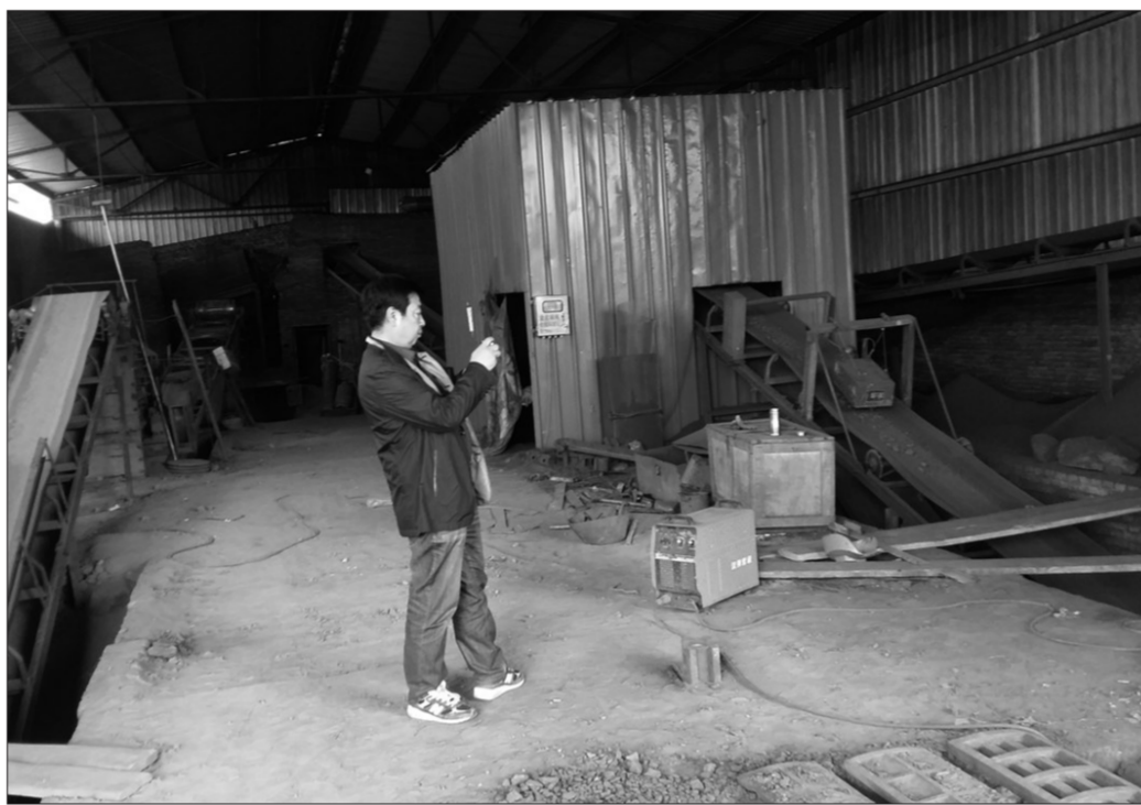
近日,河北省第六环境保护督察组进驻石家庄市开展为期20个工作日的环境保护督察。2017年4月17日上午,督察组进行现场督察发现,被督察企业未安装污染防治设施,生产车间内无组织排放严重。图为执法人员正在拍照取证。

记者从河北省印发的《2017年~2018年河北省大气污染防治强化督查工作方案》(以下简称《工作方案》)中看到,为统筹协调督查工作,河北省环保厅成立了由环保厅厅长任组长的河北省大气污染防治强化督查工作领导小组,领导小组办公室设在省环保厅督察办,强化督查工作将分两个阶段实施。