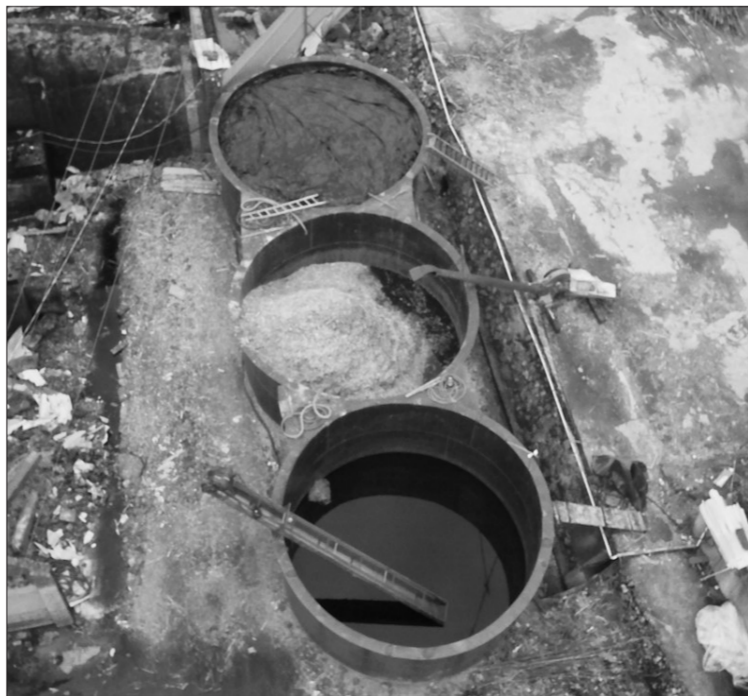
▲上图为无人机航拍发现的隐蔽性极强的非法竹沤浆点。 ▲左图为无人机航拍发现的隐藏在草丛中的排污管道。