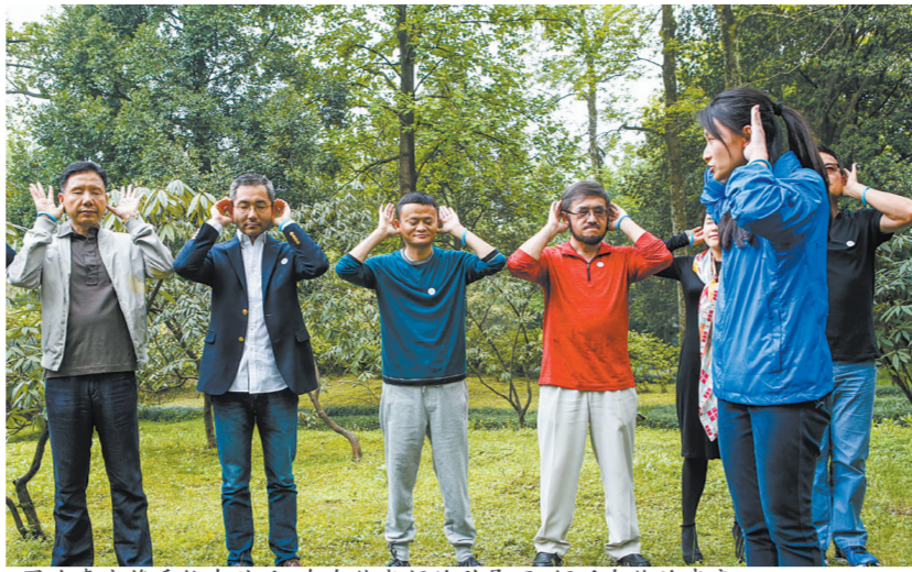
图为嘉宾将手拢在脑后,在自然老师的引导下,倾听自然的声音。

“我们小时候抬头看得到北斗七星。但现在的小孩子,几乎没有看过,甚至都不知道在什么位置。所以,建一所自然学校,很有必要。”一堂自然体验课后,马云感慨地说,治疗现代社会带来的“城市病”最好的办法,就是接近大自然。