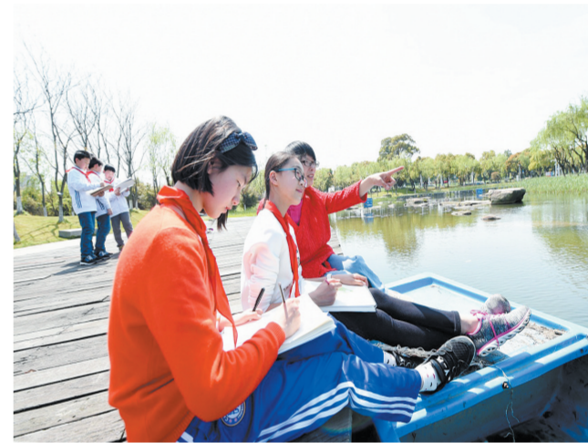
江苏省张家港市环保局最近推出“笔记自然”环保公益项目,通过观察、描绘、记录各种动植物及自然景观,播撒保护生态的种子。