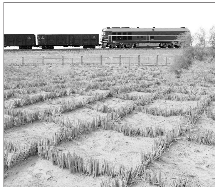
新疆阿图什市近年来采取封山育林、植树造林、网格状防风固沙等措施治理风沙。截至目前,全市已完成防风固沙生态林建设45万亩,生态环境大为改观,沙尘天气明显减少。

通知要求,各地环保部门要建立调查处理机制,加强各相关部门的工作配合,形成合力,采取“双随机”方式,定期或不定期组织开展监测质量检查,严肃查处各类环境监测活动中涉及监测数据弄虚作假行为。