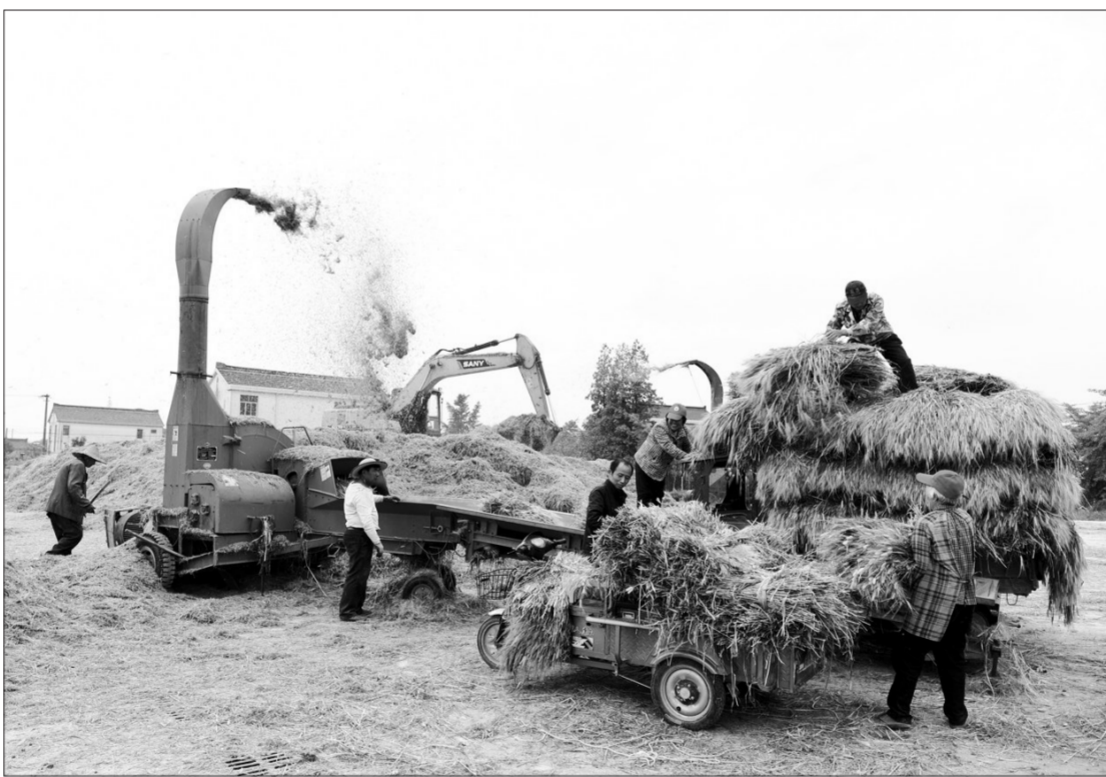
江苏省海安市重点推进秸秆固化成型燃料化、还田机械化、养畜饲料化、棚架育苗基料化、编织加工原料化“五化”利用,农作物秸秆综合利用率达90%以上。海安市高新区向阳奶牛场近日忙着收购秸秆粉碎青贮,麦收季节预计收储万吨“面包草”用来饲喂奶牛,可解决周边2000多亩夏熟秸秆消化难题。