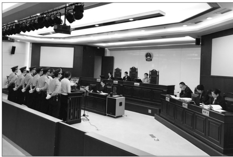
图为“上海垃圾非法倾倒苏州太湖西山岛案”庭审现场。

章和技术标准等,确保案件定性准确,认定事实清楚,适用法律正确。合议庭还转达了被告人陆小弟家属的法律援助申请,注重保障被告人合法权益。