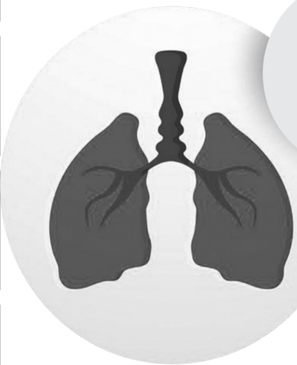
数据来源:中国控制吸烟协会、健康时报、生命时报、央视等

每周,70%的中国成年人都会暴露于二手烟中。每年约有10万非吸烟者死于二手烟的暴露,其中22000多名死于肺癌。