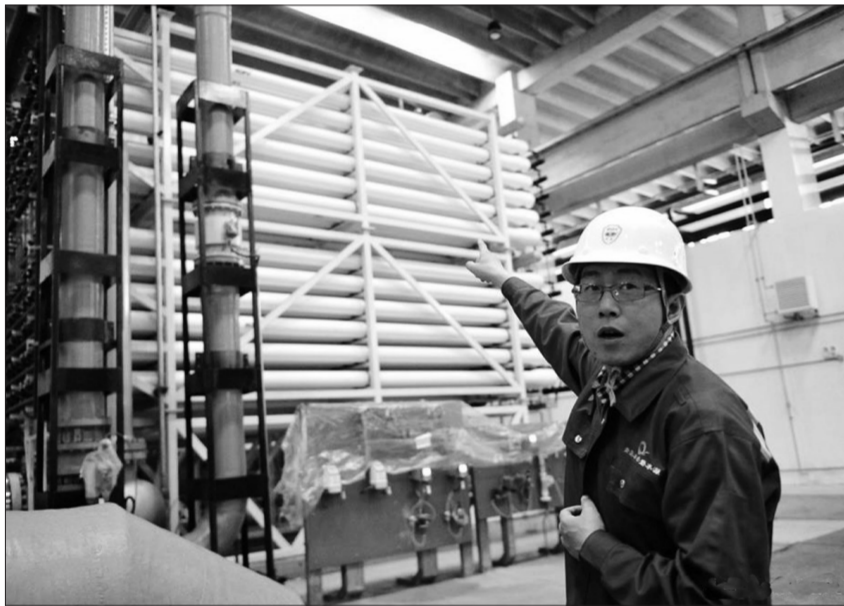
记者日前来到山东青岛董家口经济区,实地拍摄了我国首个自主研发、设计、建设的青岛水务碧水源海水淡化有限公司大型海水淡化工程。项目总规模为30万吨/日,目前建成的一期工程规模为10万吨/日,投资额约8亿元。海水经过处理后将成为合格的工业用水。

张曙光强调,要根据环境问题产生的原因、行业等,厘清各个环节、各级各部门的责任,严格执行《安徽省党政领导干部生态环境损害责任追究实施细则(试行)》。要严明工作纪律,对避重就轻、该移送不移送、该追责不追责、该执法不执法的,要严肃追责问责。