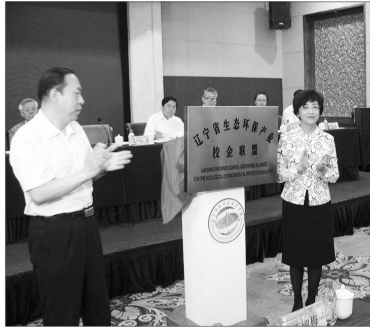
由辽宁林业职业技术学院牵头组建的辽宁省生态环保产业校企联盟日前在沈阳成立,已有217家单位成为联盟成员。联盟将促进高校和各成员单位深度融合,提升生态环保产业专业知识、人才、科技的供给质量和水平。

下一步,青海省纪委将联合相关职能部门,开展专项监督检查,对发现的问题严肃追究问责并通报曝光。