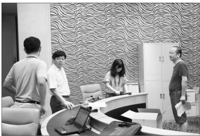
2016年7月23日,凌晨01:52 驻江西中央环保督察组工作室

该都是有生以来第一次参加以“中央”打头的督察工作,我们应该感到无比骄傲和荣耀,也更应该增强我们的使命感和责任感,不负党中央国务院的重托,因为这是具有历史担当的工作!”从前期准备到进驻督察,部领导殚精竭虑,单位领导亲力亲为,现场督察人员全身