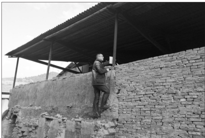
2017年2月21日 17:40 云南省昆明市某塑料加工坊旁

家问他:“你上去的时候不担心墙会倒塌吗?不担心万一摔到满是杂物的地上受伤吗?不担心铁锈会导致破伤风吗?不担心因姿势不雅和满身尘土而毁坏了光辉形象吗?”他淡然地说:“不看一下心里没底,把事情搞清楚心里才踏实,即使受