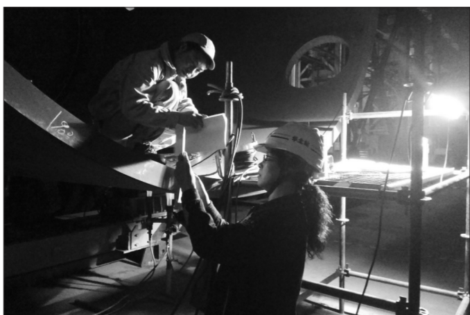
2017年1月2日,晚上21:07 广州南沙东方电气(广州)重型机器有限公司车间

的质量管控力度。 自2016年改革驻厂监督模式以来,华北站的驻厂监督将自主巡检与见证点监督相结合,并加大周末、节假日、夜间