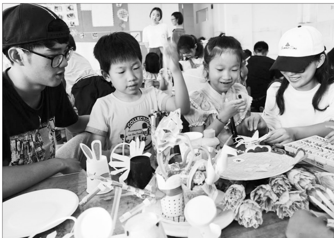
江苏科技大学的志愿者日前来到镇江市润州区实验幼儿园,开展“变废为宝、从我做起”活动,指导小朋友用废旧材料制作各种环保工艺品,引导孩子们从小增强低碳环保和资源节约意识。

据了解,贵州省现有钢铁、焦化、水泥、建筑陶瓷平板玻璃、钙镁、石材加工(含玉石加工、云母加工)、铸造、煤化工等八大行业企业2127家,年燃煤消耗1065万吨、排放二氧化硫1.85万吨、排放氮氧化物2.42万吨、排放颗粒物3.06万吨,污染排放严