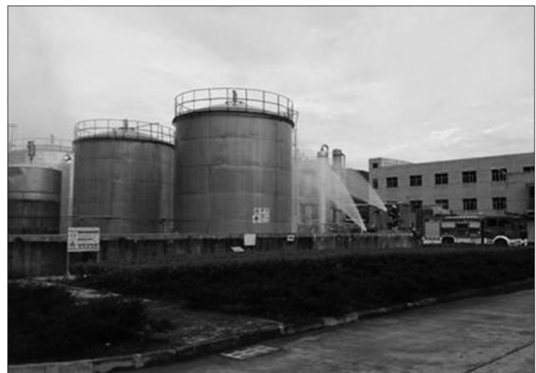
福建省沙县近日举行甲醇泄漏突发事故应急演练。演练模拟沙县宏盛塑料有限公司甲醇储罐的罐顶阀门老化导致甲醇泄漏,在封堵过程中大量泄漏的甲醇形成爆炸性混合气体突然起火。安监、公安、消防、环保等部门联合开展应急处置,直至现场环境空气、周边地表水全部符合环境质量标准。 曹家新 熊敏 摄

在编制整体达标规划的同时,石家庄市今年还结合本地实际以及大气污染防治的重点难点,同步编制或修订了《矿山关闭复绿、砂场生态恢复和西部太行山生态绿化三年规划》《散煤压减替代规划》《产业园区发展与调整规划》等6个专项规划。