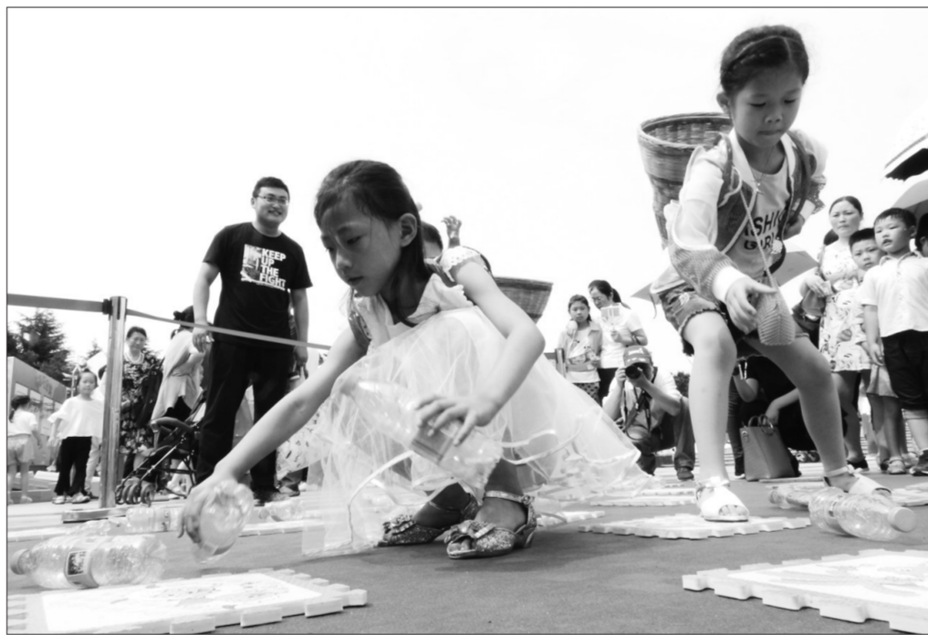
江苏省连云港市苍梧绿园中心广场近日举行“环保嘉年华”活动,将互动性环保体验与知识嘉年华融为一体,让小朋友在欢乐中了解学习环保知识,提升环保意识。

下一步,青岛市环保局将组织开展火电、造纸行业企业持证排污情况专项检查,严肃查处无许可排污、不按许可排污、谎报瞒报等违法行为。