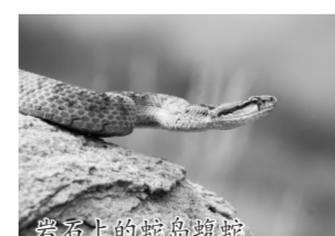
岩石上的蛇岛蝮蛇