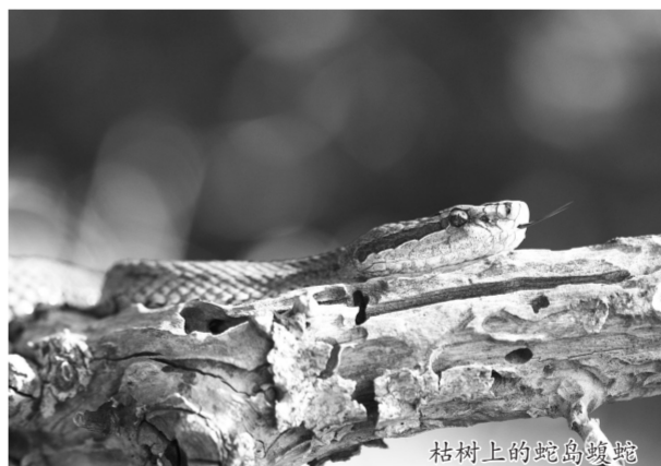
枯树上的蛇岛蝮蛇