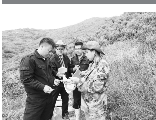
蛇岛蝮蛇生命表研究