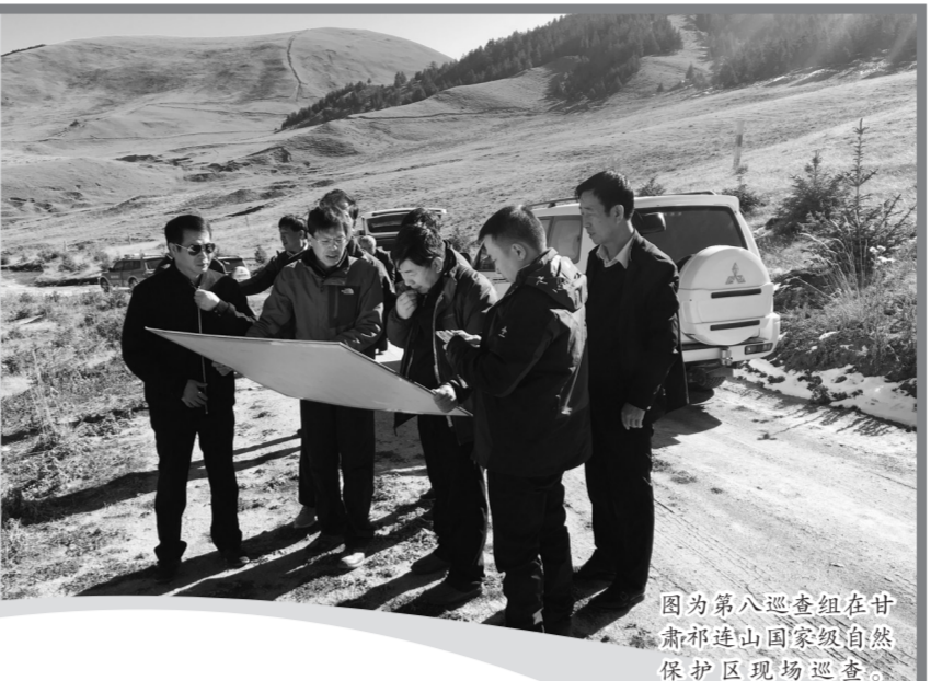
图为第六巡查组在甘肃祁连山国家级自然保护区现场巡查。

为贯彻落实中共中央办公厅、国务院办公厅关于甘肃祁连山国家级自然保护区生态环境问题督查处理情况及其教训的通报(以下简称《两办通报》)精神,环境保护部等七部委联合组成10个“绿盾2017”国家级自然保护区监督检查专项行动国家督查组,共对130个自然保护区进行了实地巡查。其中国家级保护区112个,省级保护区17个,市级保护区1个。