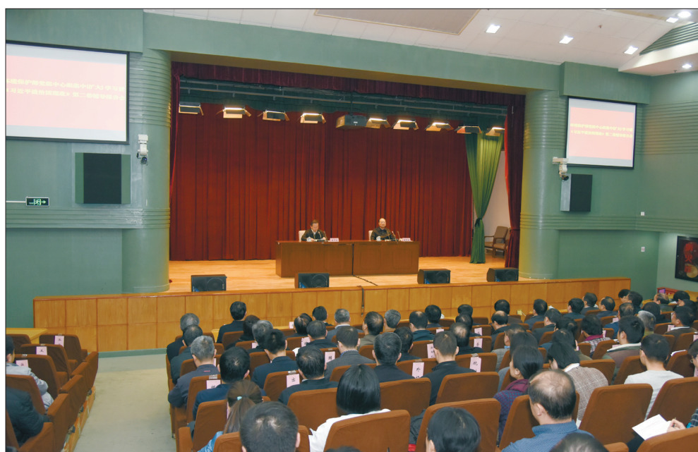
11月30日,环境保护部党组书记、部长李干杰在京主持党组中心组(扩大)学习暨《习近平谈治国理政》第二卷辅导报告会。

本报记者杜宣逸11月30日北京报道 11月30日,环境保护部党组书记、部长李干杰在京主持党组中心组(扩大)学习暨《习近平谈治国理政》第二卷辅导报告会。