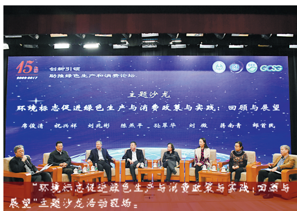
“环境标志促进绿色生产与消费政策与实践:回顾与展望”主题沙龙活动现场。