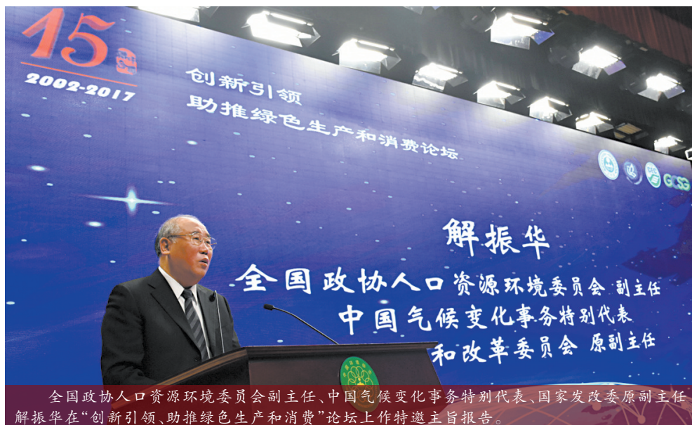
全国政协人口资源环境委员会副主任、中国气候变化事务特别代表、国家发改委原副主任解振华在“创新引领、助推绿色生产和消费”论坛上作特邀主旨报告。

三是发挥环境标志制度优势,创新环境治理新途径。我国现行环境政策多集中在生产领域,且以约束和监管为主要方式。环境标志将环境管理要求引入消费领域,可以拓展环境治理的领域和途径,使公众真正参与治理和监督过程。为此,应积极做好环境标志产品及相关企业信息公开和宣传工作,为公众参与监督提供有效支持和保障。同时,应积极将环境标志认证从产品领域扩大至生产和服务领域,在生产领域和一些资源消耗大和污染排放严重的大宗原材料产品方面开发环境标志标准,引导企业的可持续生产,减少资源使用,降低污染和温室气体排放;在服务领域,以电子商务和快递服务等行业为切入点,积极扩大绿色宾馆、绿色学校、绿色家庭、绿色物流、绿色供应链认证,引导全社会形成绿色生产、绿色消费、绿色生活新模式。