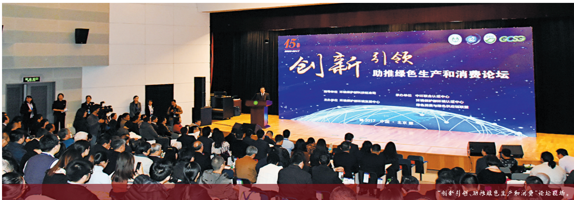
“创新引领、助推绿色生产和消费”论坛现场。

会上,中环环境保护基金会名誉理事长、被誉为“中国环境保护之父”的曲格平先生和解振华先生被授予“中国环境标志特别荣誉”。主办方还对建立和推动中国环境标志制度的老领导、支持环境标志工作的企业和机构授予了相关荣誉。