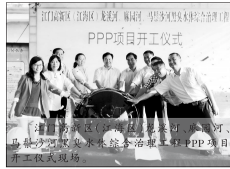
江门市高新区(江海区)龙溪河、福溪河、马岩河黑臭水体综合治理工程PPP项目开工仪式现场