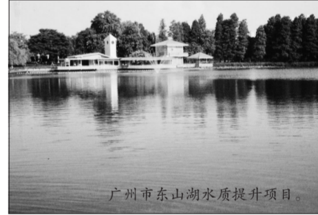
广州市东山水质提升项目