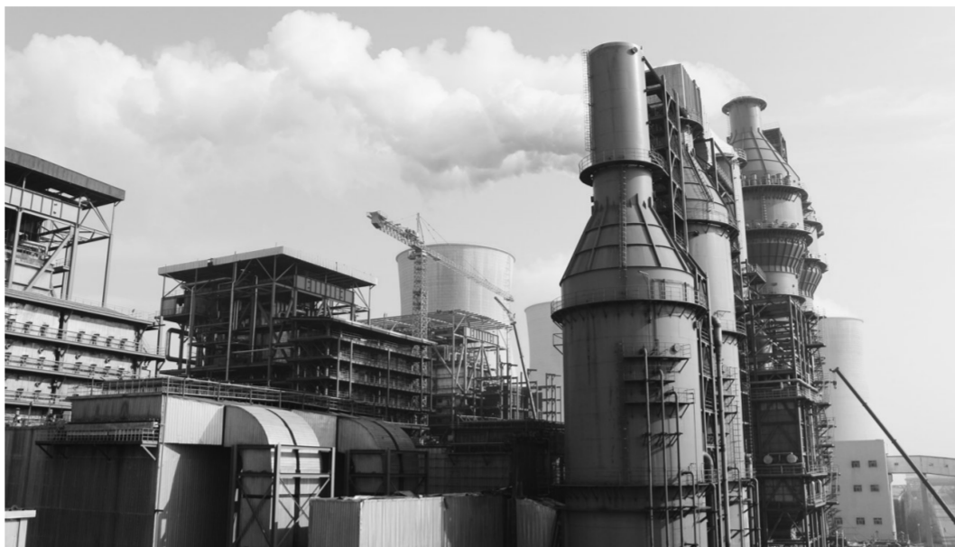
为高质高效完成燃煤机组(锅炉)超低排放改造工程,山东省聊城市定期调度,详细掌握更新改造工程的进展情况。图为晋西集团脱硫脱硝设施。

为确保各项工作落实到位,聊城市成立10个督导组,由市委督察任组长,市人大、市政协领导任副组长,定期深入一线开展督导检查,强化社会监督。在面源污染防治方面,聊城市加快重点河流堤坝内种植