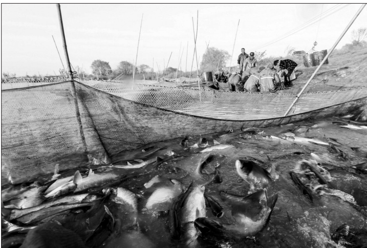
近年来,安徽省庐江县加大黄颡湖湖区生态保护力度,有效增殖放流投放鲢鱼等淡水鱼类,湖区水质得到较大改善,生态效益明显提升。图为黄颡湖沿岸渔民正在湖里捕鱼。

据悉,遂宁通过绿色生活博览会的形式将绿色科技展示与公众互动相结合,引导绿色消费和绿色生活方式的形成,推动公众形成绿色生活新时尚。